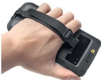
CORREA DE MANO

Scanner 1D/2D (Opcional) GPS Dual Wifi NFC (No soporta pagos)