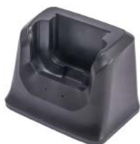
BASE DE CARGA