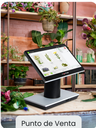
Punto de Venta

Nuestras soluciones permiten hacer la toma de pedidos desde varios entornos.